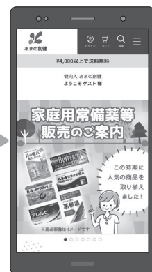
ゲストユーザーでログイン完了